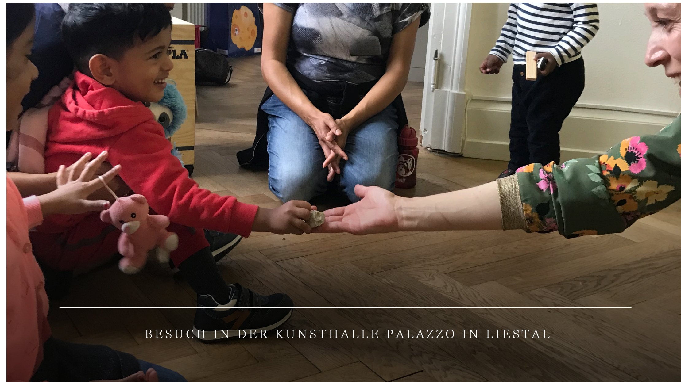
BESUCH IN DER KUNSTHALLE PALAZZO IN LIESTAL